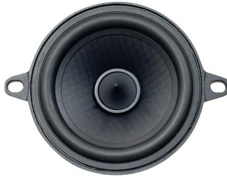
EX 80 PHASE EV03