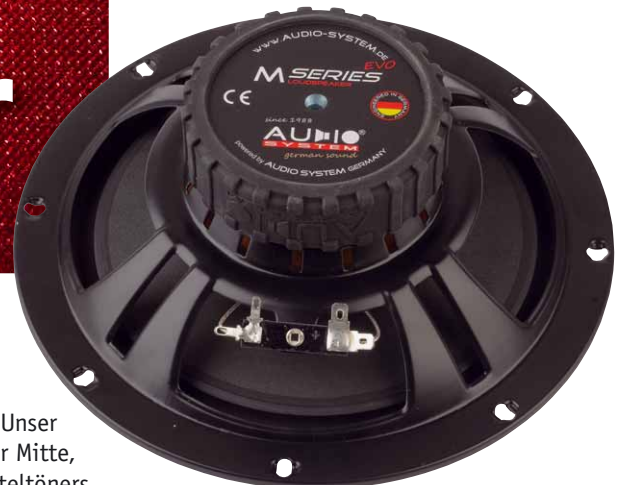
Der Antrieb des M 20ers sieht vergleichsweise zierlich aus am großen Korb

Im Messlabor punktet der Tiefmitteltöner zuallererst mit satten 92 dB Kennschalldruck an 2 V. Dabei helfen ihm seine Membranfläche, die leichte Schwingenheit und die 3 Ohm Schwingspule. Das macht ihn so laut, dass er notfalls auch am Autoradio läuft. Im Mittelton gibt es sogar noch mehr Schalldruck,