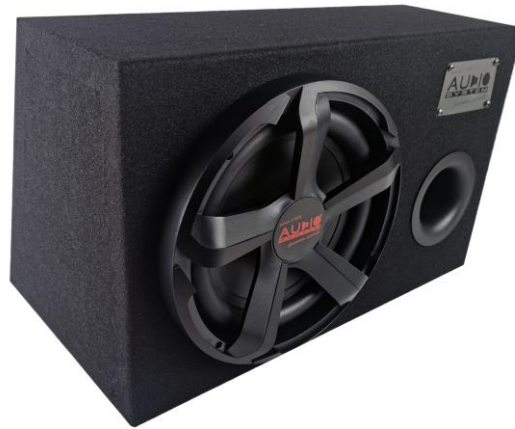
CARBON 10 BR