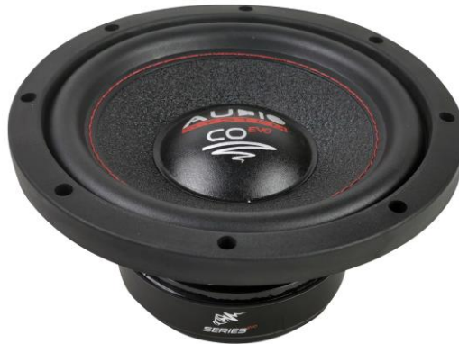
CO 08 EVO