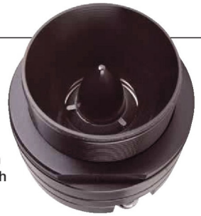
Der Hochtöner ist ein Horntreiber aus dem PA-Bereich

einer plan gedrehten oberen Polplatte. Die Membran ist hart aufgehängt und hängt in einer PA-typischen Gewebesicke. Sie besteht aus dünnem luftgetrockneten Papier und wird von einer 38-mm-Schwingspule angetrieben. Der Hochtöner gehört zur Gattung der Horntreiber, er trägt vorne am Hornansatz ein Gewinde zum Aufschrauben eines größeren Horns, hier wird es geschickt mit einer Mutter zur Befestigung des Treibers genutzt. Hinter dem Hornansatz sitzt die Membran aus Aluminium, die einen Durchmesser von 35 Millimetern hat und von einer 25-Millimeter-Schwingspule aus Aludraht angetrieben wird. Hinten heraus arbeitet die Metallmembran auf eine kleine Druckkammer, vorne sitzt eine Phase-plug, die hier ausnahmsweise den Namen verdient, da sie unterschiedlich lange Schallausbreitungswege von verschiedenen Teilen der Membran zum Hornhals ausgleicht und damit für eine korrekte Phasenlage sorgt. Dem Pärchen Hochtöner liegt ein paar Kondensatoren als Frequenzweiche bei, damit man das System sofort betreiben kann, wir wollen das Set trotzdem als Aktivlautsprecher betrachten.