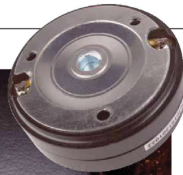
Hinter Hornansatz und Phase-plug verbirgt sich die Alumembran

kompo mit zwei Paar Tieftönern erhältlich sind. Unser H 165 PA-4 ist also das 16er-Doppelkompo und es sieht erst einmal überhaupt nicht nach Schreihals aus. Im Gegensatz zu günstigen PA-Speakern, wo generell nicht so viel Wert auf Optik wie im Car-HiFi-Bereich gelegt wird, sehen die Audio-System-Töner echt lecker aus. Der Tieftöner kommt mit schönem Gusskorb daher und er ist toll verarbeitet. Auch im Profibereich setzen sich wegen des geringeren Gewichts die Neodymantriebe durch, so verfügt auch unser kleiner Tieftöner über Neodym im Antrieb. Dieser ist wieder toll gearbeitet inklusive