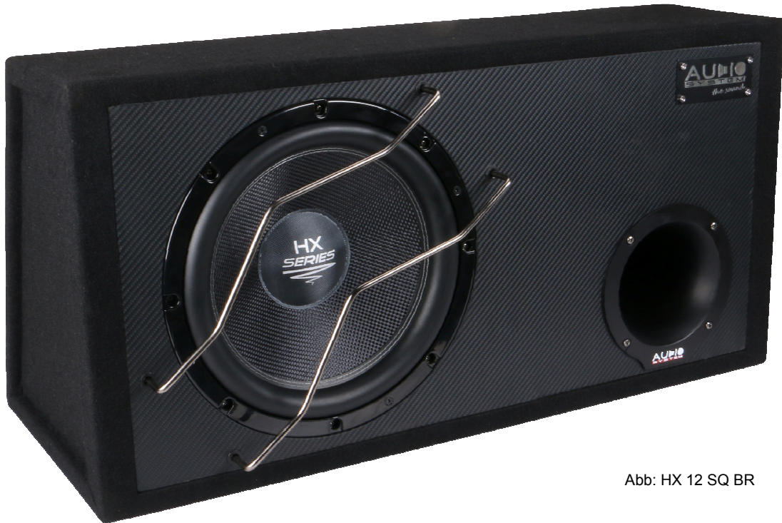
Abb: HX 12 SQ BR