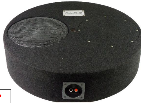
SUBFRAME R10 FLAT EVO 2