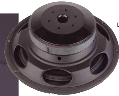
Der 10"-Bass-treiber aus der R-Serie ist in Flachbauweise ausgeführt