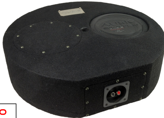
SUBFRAME RO8 FLAT EVO