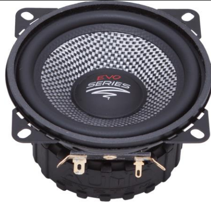
AS 100 EVO