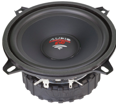
AS 130 EM EVO