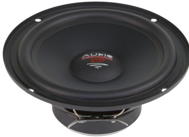
AS 165 DC EM EVO