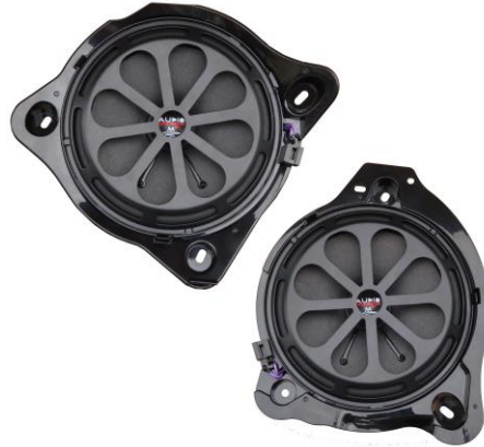
AX 08 MB UNI EVO / left and right side(pair)