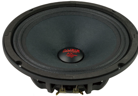
AX165 PA EVO