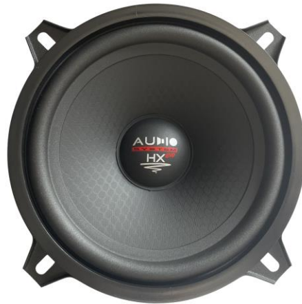
EX 130 SQ EVO3