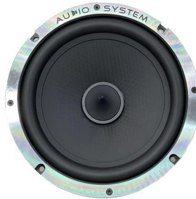
EX 165 PHASE EVO3