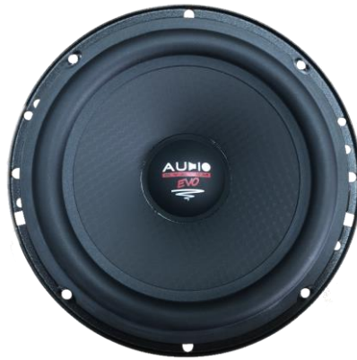
EX 200 SQ EV03