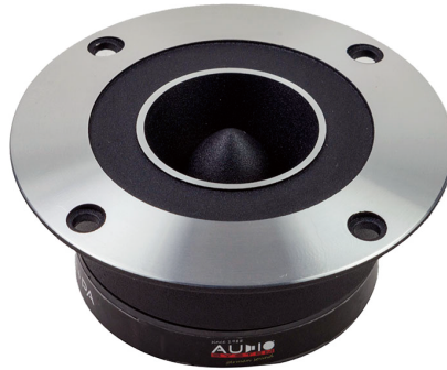
HS 24 PA EVO