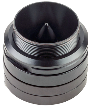
HS 30 PA EVO